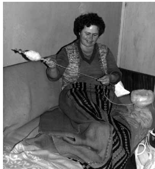
Right: Spinning yarn into thread Десно: Рачно предење

Новите времиња во кои владеат други норми, како и инвазијата на индустриските производи ставија крај на ова творештво кое никогаш нема да се повтори. Заради тоа хародните носии се чуваат под специјален третман и заштита во музеите на Македонија како единствено оригинално благо и како жив сведок за културниот живот низ кој минувал и создавал македонскиот народ.